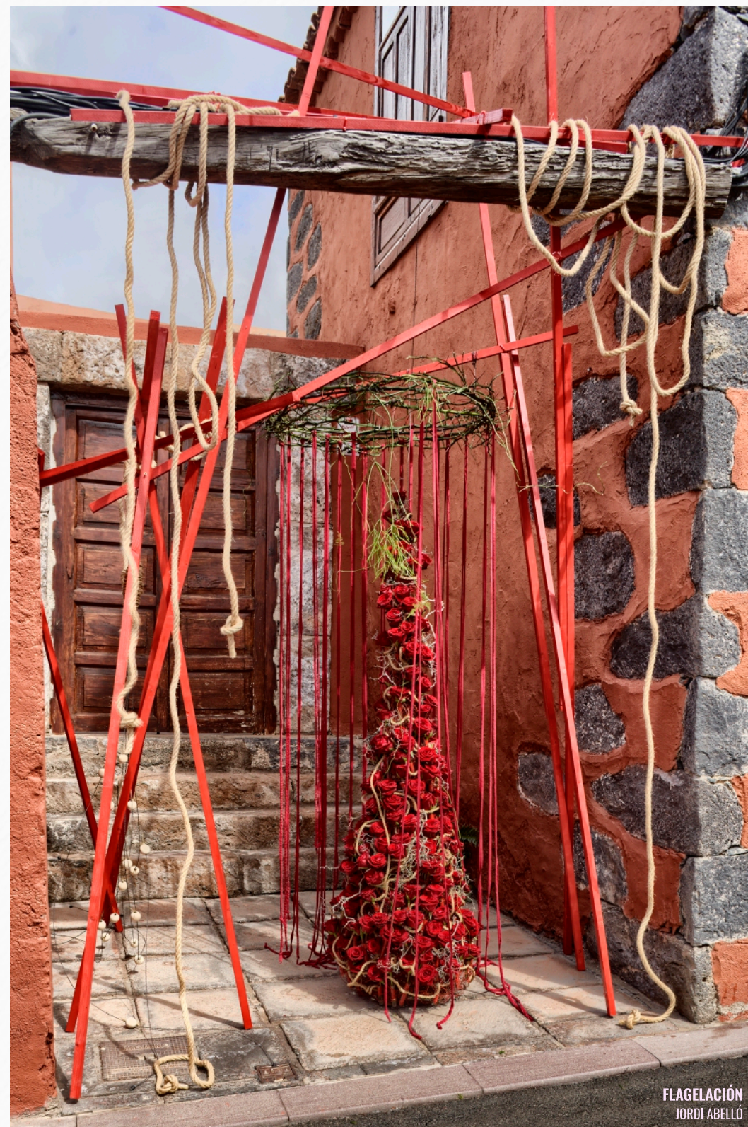
FLAGELACIÓN JORDI ABELLÓ