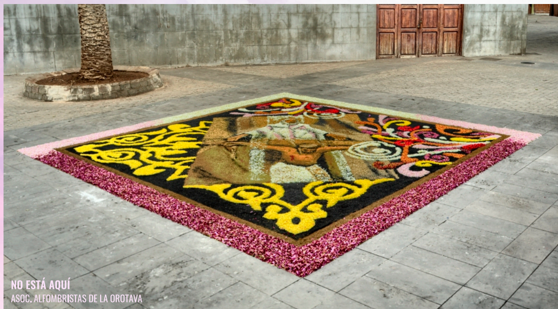
NO ESTÁ AQUÍ ASOC. ALFOMBRISTAS DE LA OROTAVA