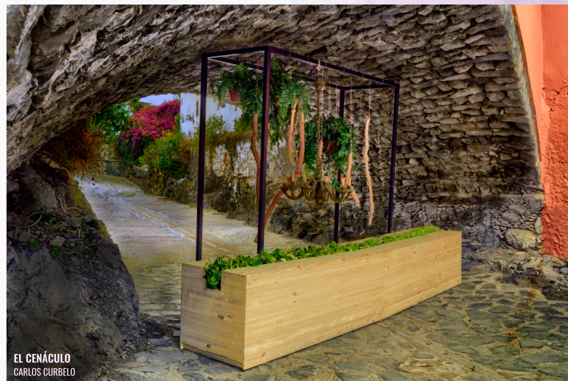
EL CENÁCULO CARLOS CURBELO