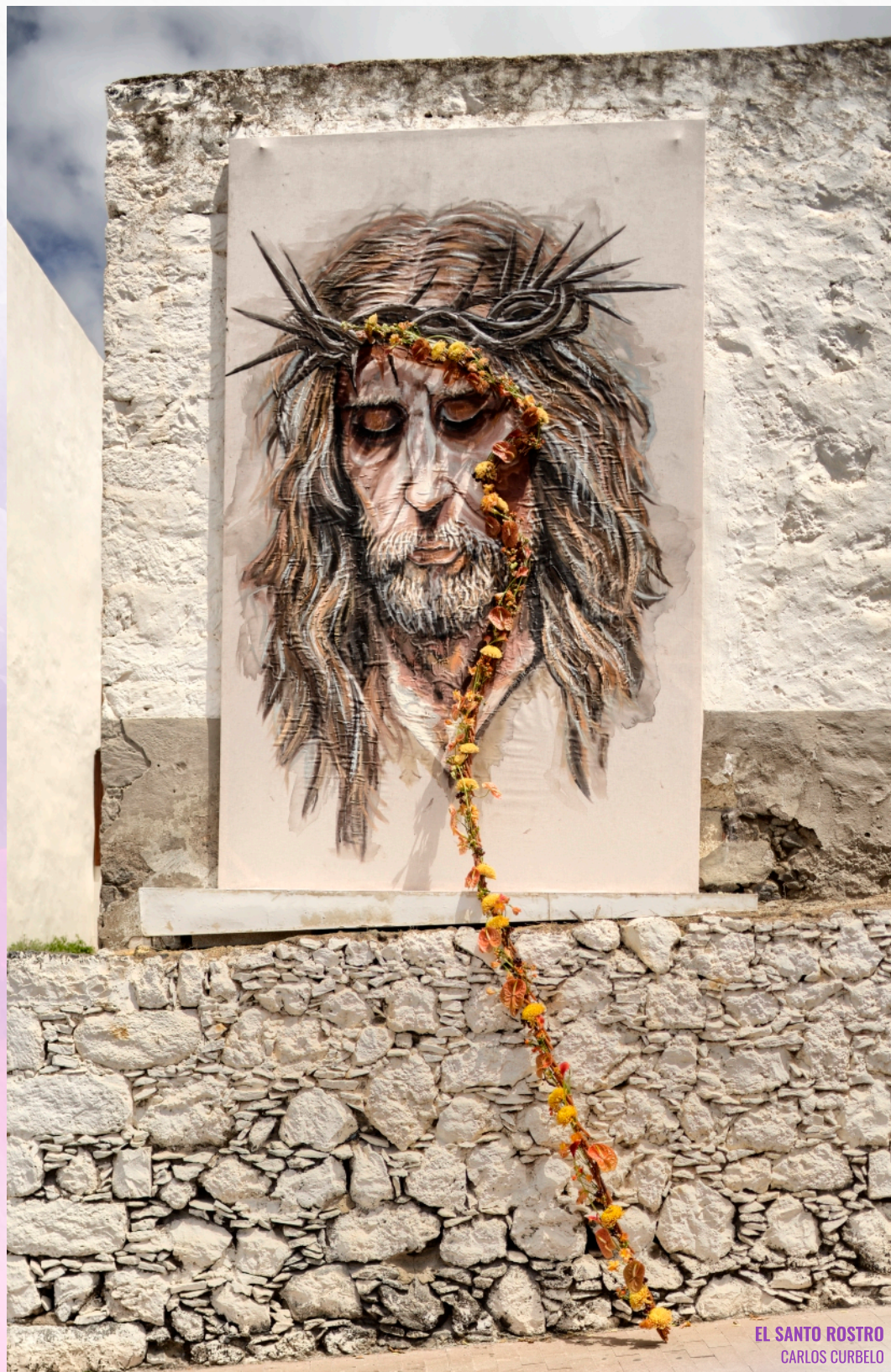
EL SANTO ROSTRO CARLOS CURBELO