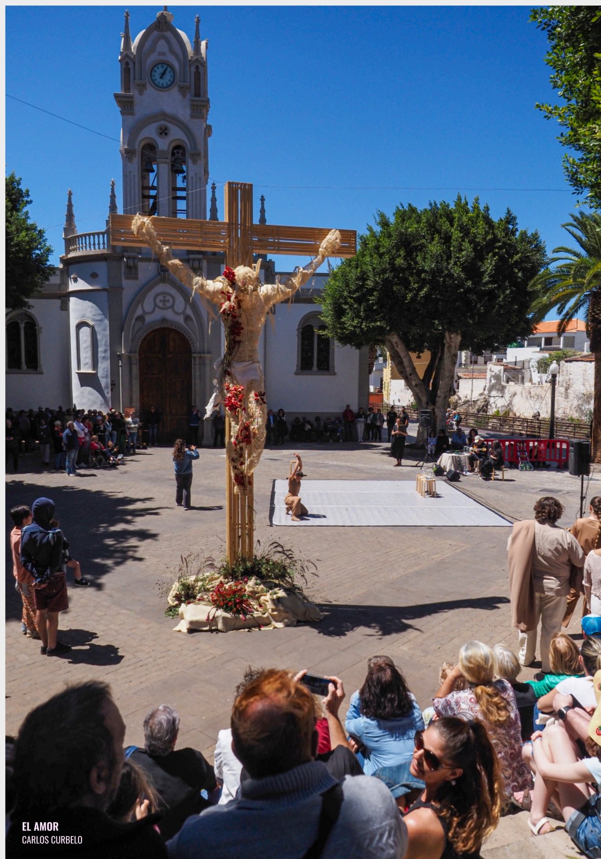
EL AMOR CARLOS CURBELO