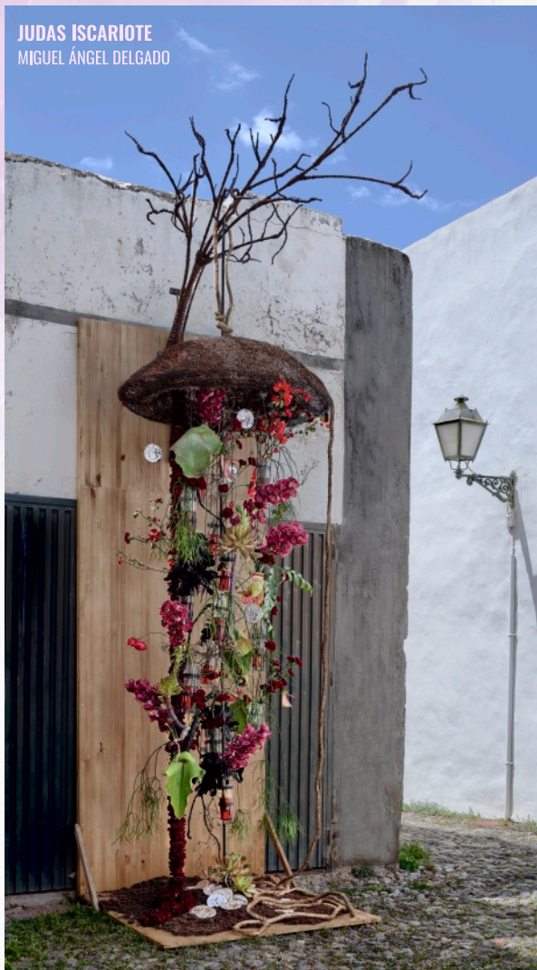
JUDAS ISCARIOTE MIGUEL ÁNGEL DELGADO