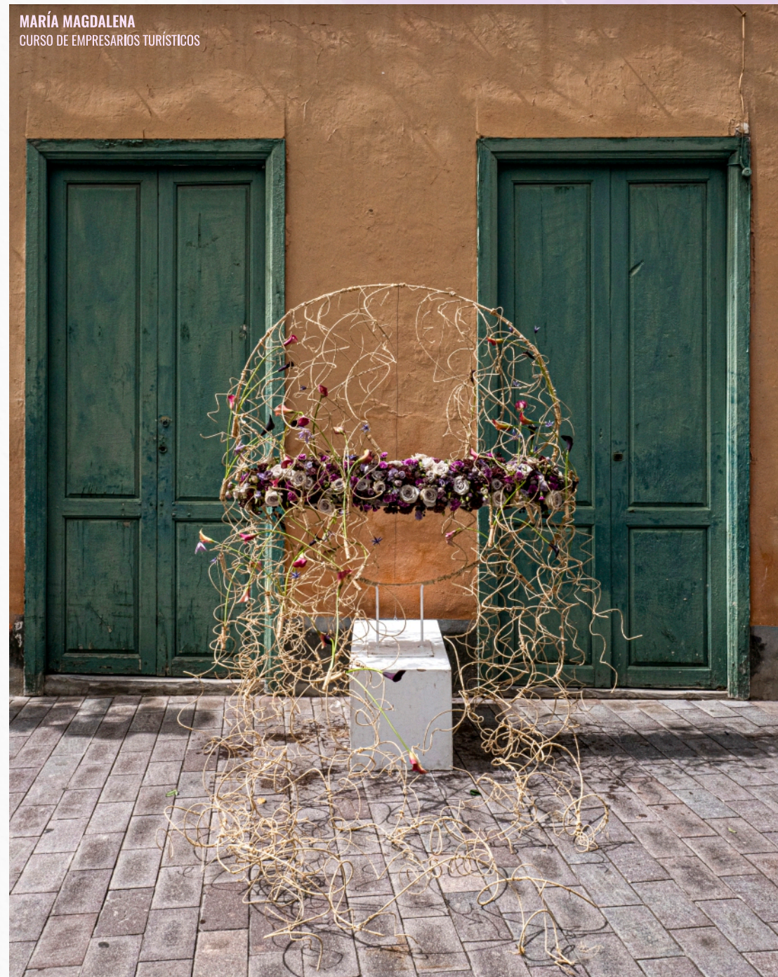
MARÍA MAGDALENA CURSO DE EMPRESARIOS TURÍSTICOS