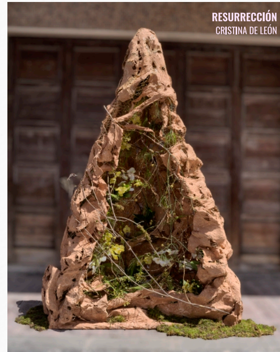
RESURRECCIÓN CRISTINA DE LEÓN