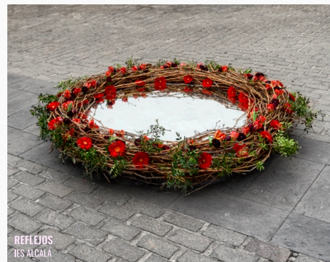
REFLEJOS IES ALCALÁ

Die Schaufenster der Geschäfte im historischen Zentrum zeigen eine Ausstellung mit Werken von kanarischen Künstlern, von denen einige schon als Gäste der blühenden Osterwoche teilgenommen haben. Die Kunstwerke, die religiöse oder florale Themen zeigen, können während der ganzen Karwoche ununterbrochen betrachtet werden, dank der Unterstützung der Geschäfte, die Öffnungszeiten verlängern.