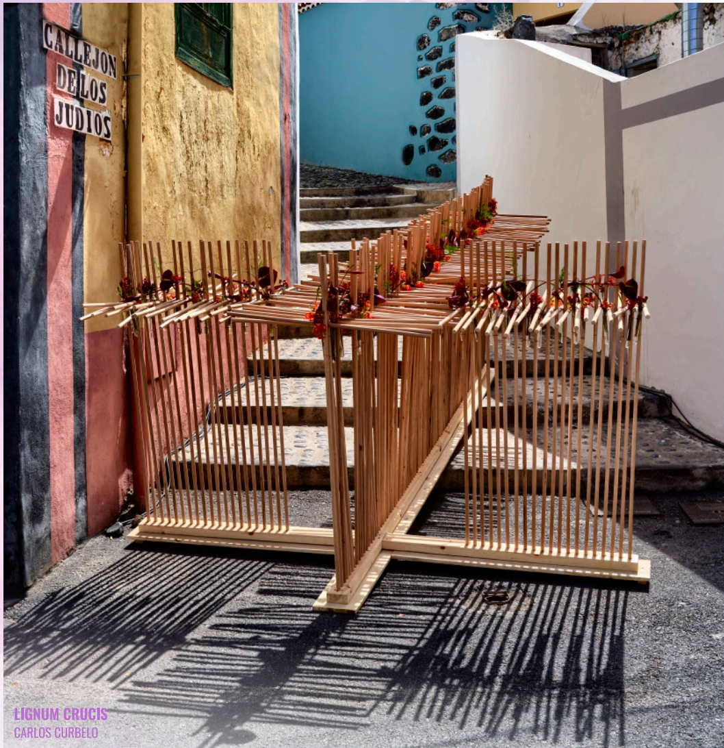
LIGNUM CRUCIS CARLOS CURBELO