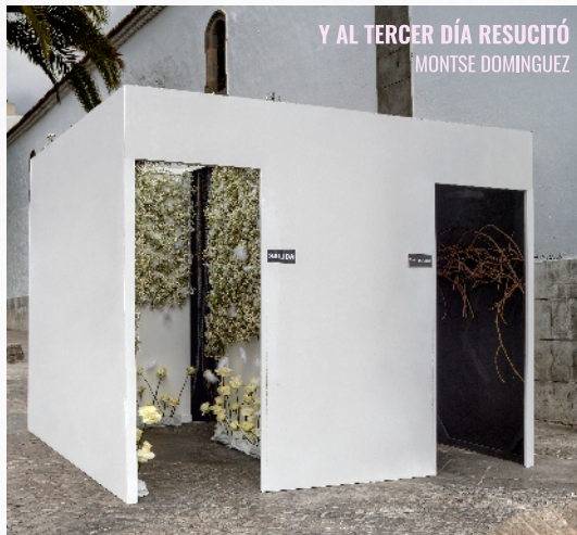
Y AL TERCER DÍA RESUCITÓ MONTSE DOMÍNGUEZ