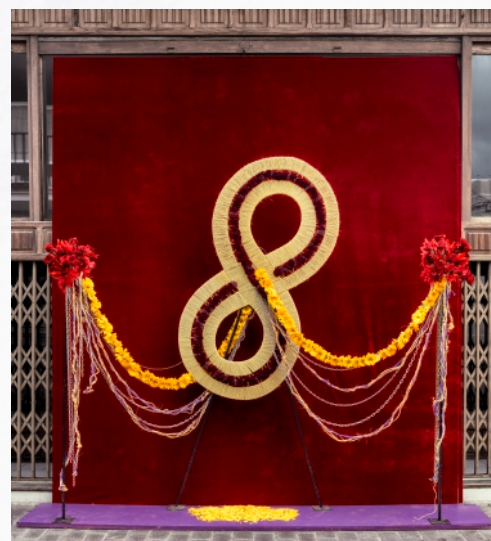
PRENDIMIENTO ÁNGELA BATISTA