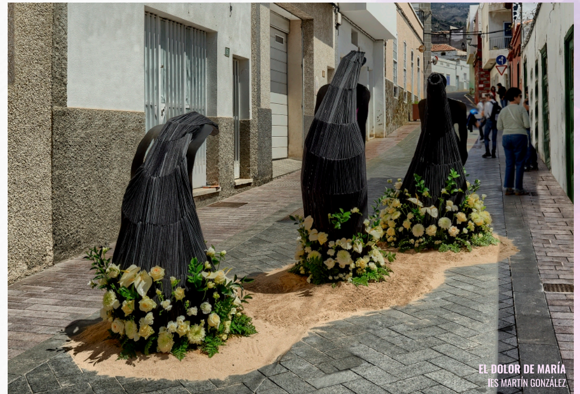
EL DOLOR DE MARÍA IES MARTÍN GONZÁLEZ